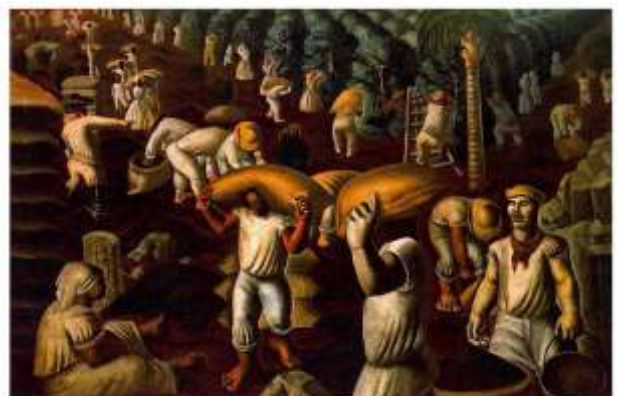
Cândido Portinari (Brasil), Café, - Tricentenário